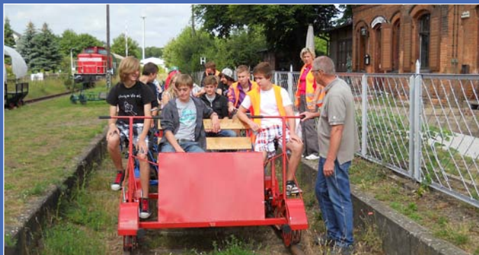
Eine Schulklasse mit gekoppelten Fahrraddraisinen kurz vor der Abfahrt vom Bahnhof Mittenwalde nach Motzener Seeperle

Für weitere Informationen stehen wir Ihnen gerne per Mail und Telefon zur Verfügung. Gerne können wir auch vor Ort einen Termin zur Besichtigung unserer Anlagen machen.