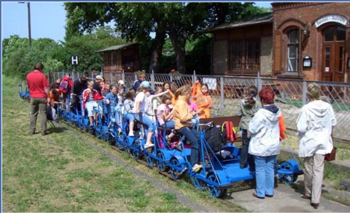
Eine aufgeregte Grundschulklasse kurz vor dem Start mit unseren Fahrraddraisinen vom Bhf. Mittenwalde (Ost)

Alle Angebote sind Komplettangebote mit Übernachtung, Bewirtung und Programm.