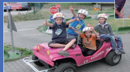
Kinder in Jumicars