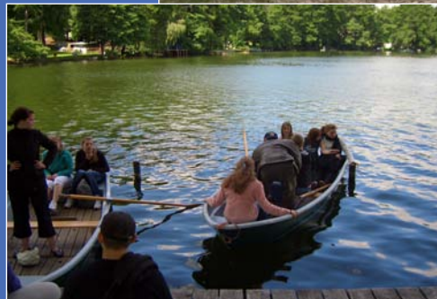
Schüler stechen mit „Ihren“ Booten in See (Motzen)