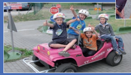
Kinder in Jumicars