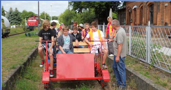
Eine Schulklasse mit gekoppelten Fahrradraisinen kurz vor der Abfahrt vom Bahnhof Mittenwalde nach Motzen Seeperle

Für weitere Informationen stehen wir Ihnen gerne per Mail und Telefon zur Verfügung. Gerne können wir auch vor Ort einen Termin zur Besichtigung unserer Anlagen machen.