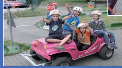
Kinder in Jumicars