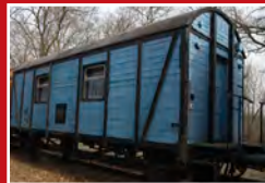
Bahnwaggon in Mittenwalde