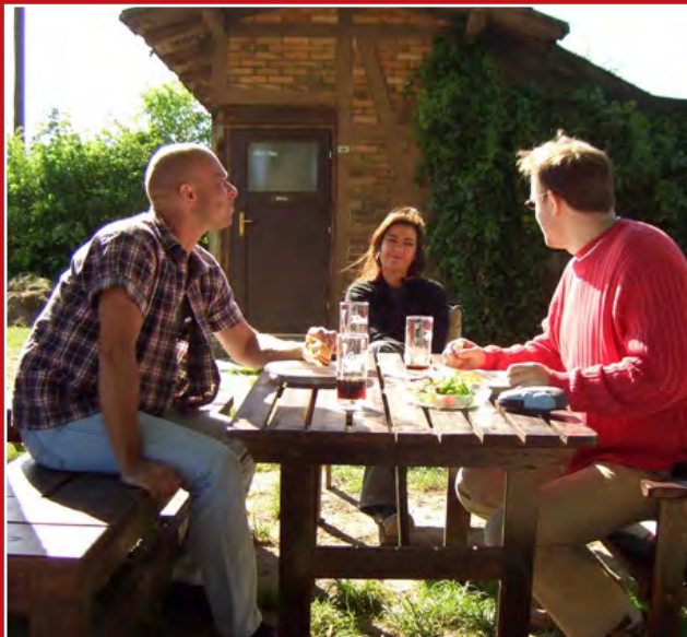
Gäste in Mittenwalde

Für weitere Informationen stehen wir Ihnen gerne zur Verfügung! Ihre Draisinenbahn Mittenwalde